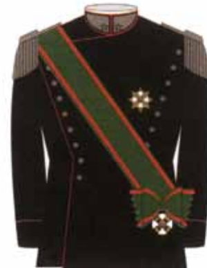
Uniforme militare doppio petto con fascia