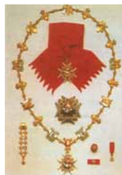
Insegne di Gran Maestro dell'Insegne Reale Ordine di San Gennaro

L'Ordine di San Gennaro venne istituito il 6 luglio 1738 da Carlo III, re delle Due Sicilie; i suoi statuti furono approvati da papa Benedetto XIV il 30 giugno 1741. L'ordine accoglieva la nobiltà napoletana che si fosse distinta per altissimi servizi al sovrano.