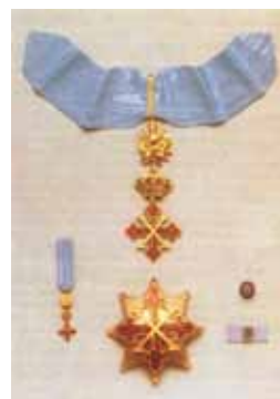
Insegne di Cavaliere di Giustizia del Sacro Militare Ordine Costantiniano di San Giorgio

L'Ordine Costantiniano di San Giorgio fu fondato secondo la tradizione nel 1190 dall'imperatore d'Oriente Isacco IV, Angelo Flavio Comneno. Fu retto dalla dinastia dei Comneno che lo tramandarono di padre in figlio, fino a quando l'ultimo discendente di quell'antica famiglia trasferì il gran magistero al duca di Parma Francesco Farnese e ai suoi successori nel 1697. Nel 1727, il duca Antonio Farnese chiamò a succedergli l'infante Carlo di Borbone, figlio della sorella Elisabetta e del re di Spagna Filippo V. Diventato re di Napoli e Sicilia, Carlo trasferì l'ordine a Napoli e il gran magistero passò a tutti i re delle Due Sicilie.