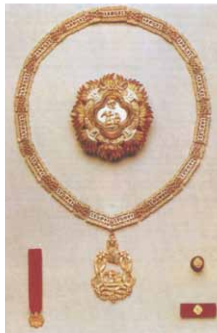
Insegna dell'Ordine Supremo della Santissima Annunziata di Casa Savoia

Esaurita la spinta delle Crociate, che aveva ispirato la creazione dei pri-