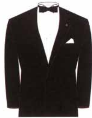
Smoking con rosetta