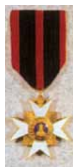
Cavaliere dell'Ordine di San Silvestro Papa

fra gli altri, oltre alla citata Legion d'Onore in Francia, l' Ordine al Merito della Repubblica in Italia, gli ordini di merito della Santa Sede e della Repubblica di San Marino, il Dannenbrog (Ordine della Bandiera Danese) in Danimarca, The Most Honourable Order of the Bath (Ordine del Bagno) nel Regno Unito, l' Ordine di Leopoldo in Belgio, l' Ordine Orange-Nassau nei Paesi Bassi.