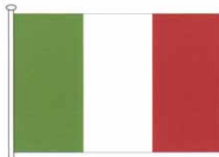
Bandiera della Repubblica Italiana