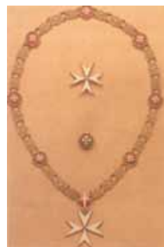
Insegne di Gran Maestro del Sovrano Militare Ordine di Malta

L'Ordine, accertato già nel 1099, venne fondato dopo la prima Crociata come ordine ospitaliero «di San Giovanni di Gerusalemme» e posto sotto la regola di Sant'Agostino. I primi statuti furono emanati nel 1121. L'Ordine attraversò i secoli con alterne vicende, spostandosi da Gerusalemme ad Acri, poi a Cipro, a Rodi, infine ottenne, nel 1530, l'isola di Malta dall'imperatore Carlo V. I cavalieri furono cacciati da Malta il 12 giugno 1798 dall'armata francese guidata da Napoleone Bonaparte. Fu solo nel 1827 che papa Leone XII trasferì a Roma la sede dell'Ordine, con la successiva conferma da parte di papa Gregorio XVI nel 1831. La nuova carta costituzionale venne approvata da papa Giovanni XXIII attraverso il Breve del 24 giugno 1961.