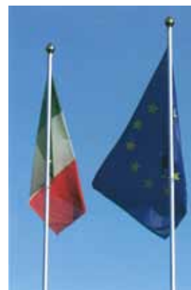
Esposizione delle bandiere su due pennoni

L'articolo 9 raccomanda che le bandiere vengano «esposte in buo-