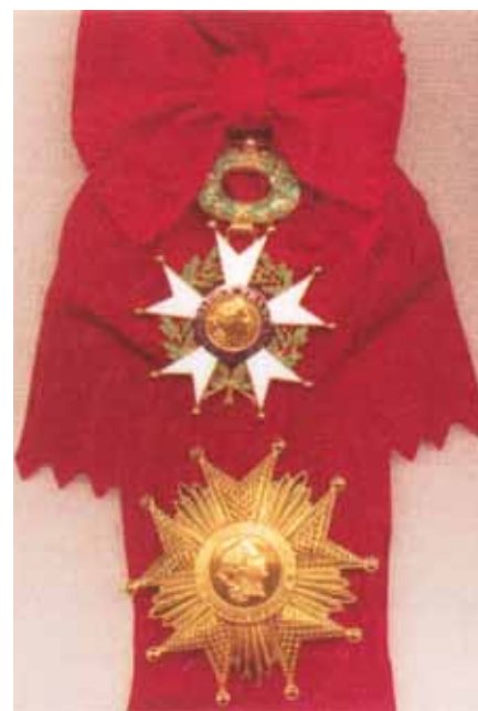
Fascia e placca di Gran Croce della Legione d'Onore Francese

Ben presto gli ordini cavallereschi, da istituzioni tipicamente europee, si diffusero in ogni parte del pianeta, soprattutto attraverso