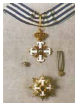
Insegne di Grande Ufficiale dell'Ordine Equestre di San Marino

È destinato a premiare i cittadini stranieri che con l'industria, il lavoro e atti municipi a favore delle opere assistenziali, si sono resi benemeriti della Repubblica.