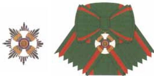
Maschile e Femminile