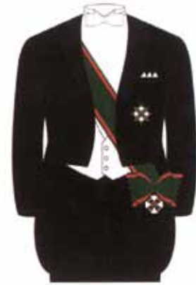
Frac da sera