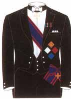
Frac da cerimonia