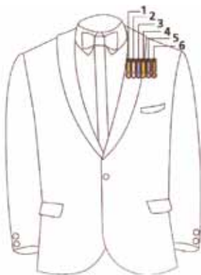
Ordine di utilizzo delle miniature con lo smoking