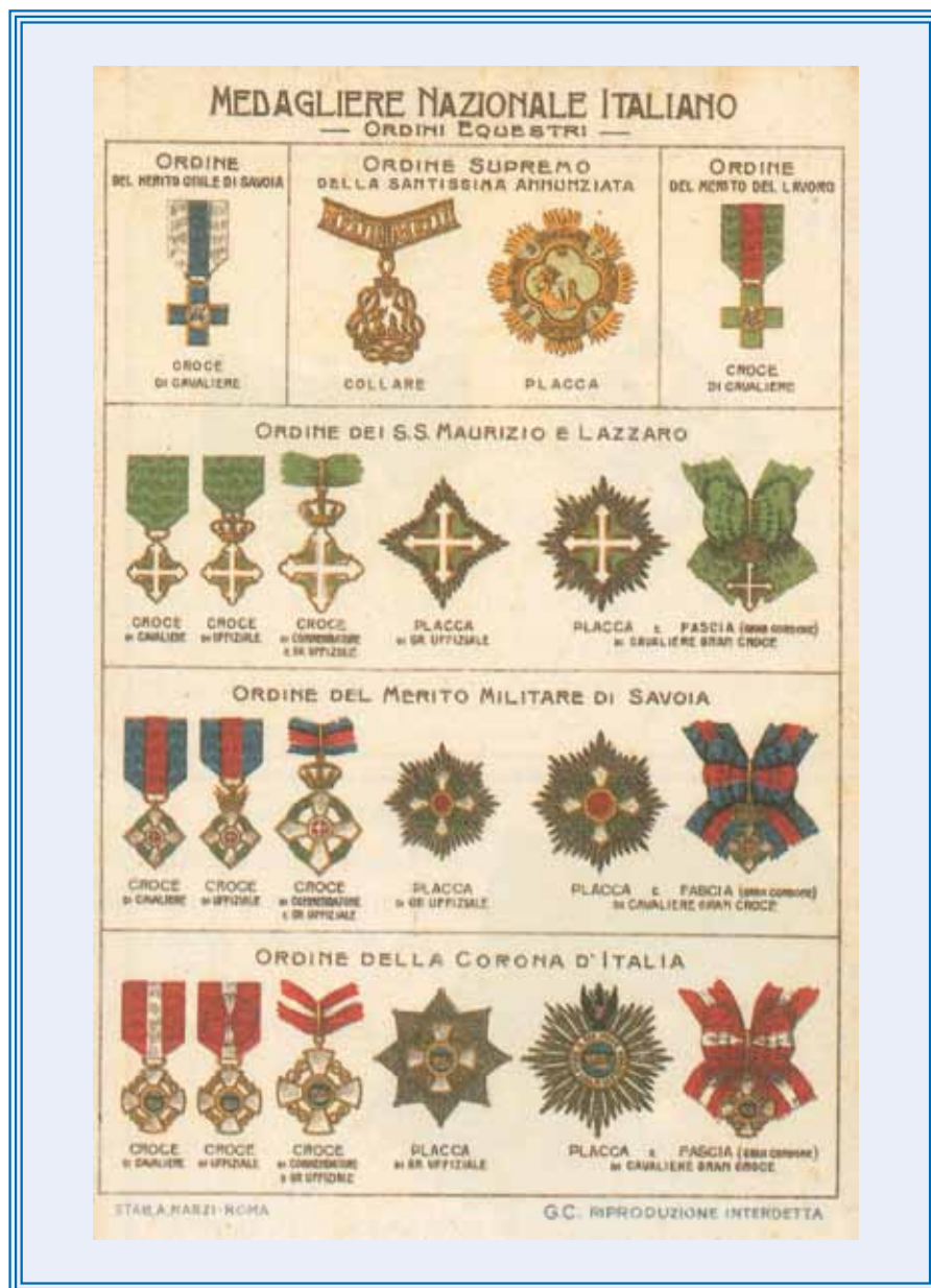
Onorificenze italiane del periodo monarchico

Il Presidente della Repubblica è capo di tutti gli ordini cavallereschi statuali. Accanto alle «distinzioni cavalleresche», in un rapporto gerarchico subordinato, vi sono le «distinzioni onorifiche» che comprendono le decorazioni, le ricompense, le medaglie e le attestazioni.