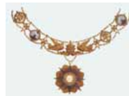
Collare dell'Ordine Piano

L'Ordine Piano detto anche «di San Pio IX», istituito nel 1559 da papa Pio IV, è stato rinnovato da papa Pio IX il 17 giugno 1847 e riformato nel 1905 da papa Pio X. Viene conferito solitamente agli ambasciatori in servizio presso la Santa Sede. La scelta della stella nell'insegna, anziché della croce come per gli altri ordini pontifici, permette di essere attribuito anche a personalità non cattoliche.