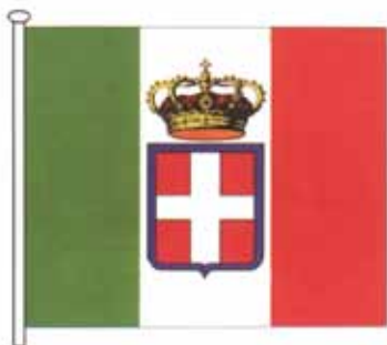
Bandiera Regno di Sardegna (1848-1861) Regno d'Italia (1861-1946)