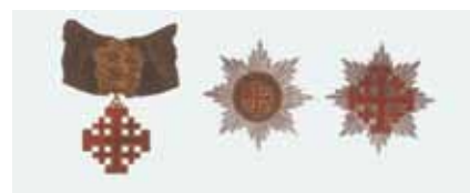
Insegne dell'Ordine Equestre del Santo Sepolcro di Gerusalemme

Ordine di «subcollazione» della Santa Sede, è uno fra i più antichi sodalizi religiosi di natura militare, voluto da Goffredo di Buglione nel 1099 allo scopo della difesa del Santo Sepolcro e dei luoghi sacri di Gerusalemme. L'Ordine è giunto alla sua attuale configurazione dopo varie riorganizzazioni, l'ultima delle quali, risalente al luglio 1977, ne ha riformato lo statuto che è stato approvato da papa Paolo VI.