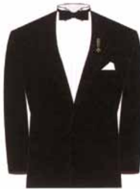
Smoking con miniatura