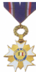
Distinzione Onore e Merito dell'U.N.C.I.