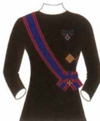
Abito femminile da cerimonia e da sera