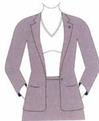
Abito femminile da giorno con spilla