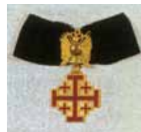
Insegne dell'Ordine del Santo Sepolcro di Gerusalemme