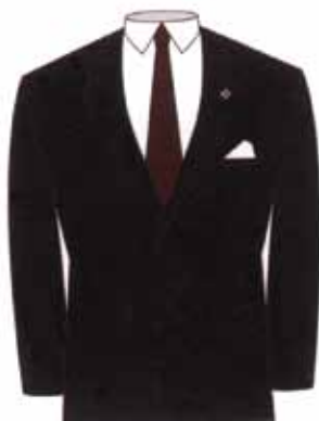
Abito maschile da giorno con rosetta