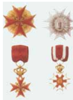
A sinistra: insegne dell'Ordine di Santo Stefano Papa e Martire

L'Ordine fu istituito da Ferdinando III di Toscana nel 1807 e riordinato dieci anni più tardi. Era destinato a ricompensare le azioni virtuose e importanti servizi resi allo Stato o al sovrano. Sospeso dopo il 1859, l'Ordine venne rivitalizzato il 19 marzo 1972 dall'arciduca Goffredo d'Asburgo, capo della Casa, e da suo figlio, l'arciduca Leopoldo.