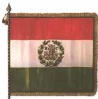
Bandiera della Repubblica Cispadana (1796-1797)

Il 4 marzo 1848 Carlo Alberto di Savoia, re di Sardegna, concesse lo Statuto e il 23 marzo 1848, all'avvio della prima guerra d'indipendenza, il tricolore fu adottato dall'esercito piemontese che si apprestava a varcare il Ticino. Il sovrano si rivolse ai popoli del Lombardo-Veneto con le parole