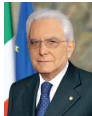
Il Presidente della Repubblica Sergio Mattarella Capo dell'O.M.R.I.

la Presidenza del Consiglio dei Ministri si conclude con la raccomandazione di corredare le segnalazioni di tutte le informazioni raccolte sulla persona, sui suoi meriti e sulle eventuali onorificenze già conferite, in modo che le singole pratiche siano il più possibile esaustive, onde evitare il dar corso a proposte non regolarmente compilate.