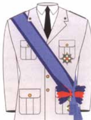
Uniforme militare con fascia e sciarpa