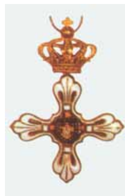
Insegne dell'Ordine del Merito sotto il Titolo di San Lodovico

L'Ordine fu istituito a Lucca il 22 dicembre 1836 e ricostituito in Parma a numero chiuso, con decreto ducale dell'1 agosto 1849.