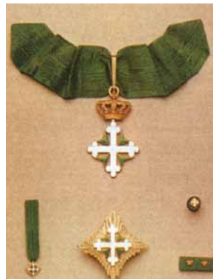
Insegne di Grande Ufficiale dell'Ordine dei Santi Maurizio e Lazzaro di Casa Savoia

Purtroppo sono numerose le istituzioni pseudocavalleresche che, senza