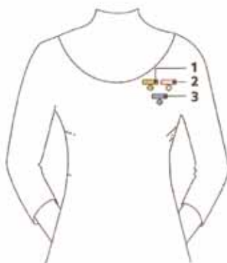
Ordine di utilizzo delle onorificenze con abito femminile