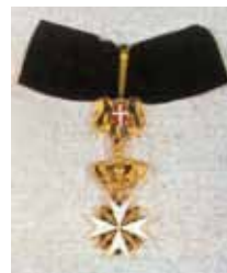
Insegne del Sovrano Militare Ordine di Malta

Quanto detto riguardo «al merito» vale anche per alcuni ordini dinastico-familiari, quali: l' Ordine al Merito sotto il Titolo di San Giuseppe della Casa Asburgo-Lorena e l' Ordine sotto il Titolo di San Ludovico della Casa Borbone-Parma .