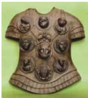
Corazza romana con falere

Ad esclusione dell'uniforme militare, le fasce, i collari e le placche si portano soltanto con il frac, abito da cerimonia per antonomasia, ma an-