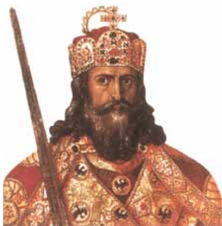
Carlo Magno (823-877 d.C.), imperatore del Sacro Romano Impero

Ebbero così origine nuovi ordini di natura dinastica che, attraverso il giuramento di fedeltà al sovrano, consentirono, seppur in forme diverse, il mantenimento degli ideali e dei principi cavallereschi. Il simbolo di appartenenza all'ordine era di norma il collare, al quale veniva appesa l'insegna; sono questi i cosiddetti ordini «di collana». Ad essi appartengono fra gli altri: l' Ordine Supremo della Santissima Annunziata di Casa Savoia, quello asburgico del Toson d'Oro , l' Ordine Supremo di Cristo della Santa Sede, quello britannico della Giarrettiera , creato da Edoardo III nel 1348 e l' Ordine dell'Elefante Bianco di Danimarca, istituito nel 1464 da re Cristiano I.